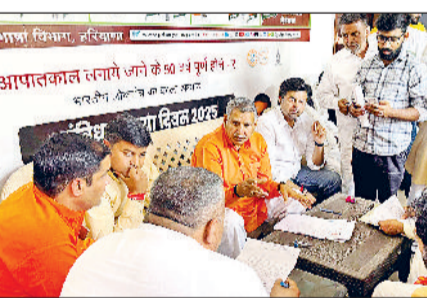
नारनौल। समस्याएं सुने सांसद धर्मवीर सिंह।