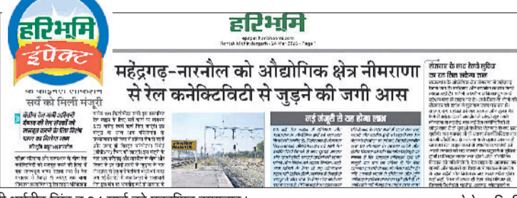
महेन्द्रगढ़-नारनौल को औद्योगिक क्षेत्र नीमराणा से रेल कनेक्टिविटी से जुड़ने की जगगी आस

नारनौल। सांसद चौधरी धर्मवीर सिंह व 24 मार्च को प्रकाशित समाचार। कनेक्टिविटी से जुड़ने की जगगी आस" खबर प्रकाशित की थी। अब दो दिन पहले ही सांसद चौधरी धर्मवीर सिंह ने रेल मंत्री अश्विनी वैष्णव से मुलाकात की और नीमराणा से अटेली होते हुए महेन्द्रगढ़ और दादरी को जोड़ने का मांग रखी है। शुक्रवार मीडिया से बातचीत करते हुए सांसद ने यह जानकारी दी। सांसद ने यहां तक कहा कि वह अपनी तरफ से योजना सिरे चढ़ाने के लिए प्रयास करेंगे। रेल मंत्रालय ने रेवाड़ी से जयपुर वाया नीमराणा नई रेल लाइन परियोजना के लिए एफएलएस की मंजूरी दी है। करीब 191 किलोमीटर लंबी इस प्रस्तावित रेल लाइन के लिए सर्वे कार्य पर लगभग 5.73 करोड़ रुपये खर्च किए जाएंगे। इस मंजूरी के साथ अब परियोजना के क्रियान्वयन की दिशा में प्रक्रिया तेज हो गई है और जल्द ही विस्तृत परियोजना रिपोर्ट (डीपीआर) तैयार की जाएगी। इस मंजूरी के बाद अब महेन्द्रगढ़ और नारनौल के बीच और जिला के इन दोनों शहरों के जुड़ाव के बाद नीमराणा से रेल कनेक्टिविटी करने की आस जग गई है। ऐसे में अब सांसद के साथ-साथ जिला के सत्ताधारी नेता इस मांग पर भागदौड़ करें तो रोजगार के साथ-साथ रेल सुविधा का लाभ महेन्द्रगढ़ जिला के लोगों को भी मिल सकता है।