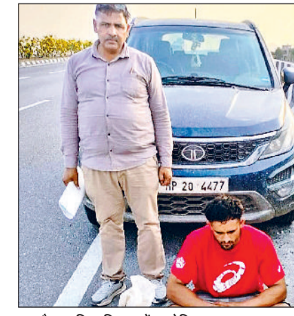
नारनौल। पुलिस गिरफ्तार में आरोपित।

हरिभूमि न्यूज नारनौल सीआईए ने एक शांति व आदतन आरोपित को गिरफ्तार करने में सफलता हासिल की है। टीम ने उससे एक चोरी की गाड़ी व मंदिर के दानपात्र से चुराए गए लाखों रुपये बरामद किए हैं। प्रारंभिक जांच में सामने आया है कि आरोपित पर पहले से ही हत्या के प्रयास व आर्म्स एक्ट सहित चार अन्य जघन्य आपराधिक मामले दर्ज हैं। सीआईए नेशनल हाईवे 148 बी पर गांव मंहाणा के पास गश्त कर रही थी, तभी टीम को गुप्त सूचना मिली कि एक व्यक्ति चोरी की गाड़ी में आ रहा है और उसने जयपुर के पास एक मंदिर का दानपात्र तोड़कर नकदी भी चुराई है। सूचना को पुख्ता मानकर सीआईए की टीम ने तुरंत मंहाणा गांव के पास नाकाबंदी कर चेंकिंग शुरू कर दी। कुछ