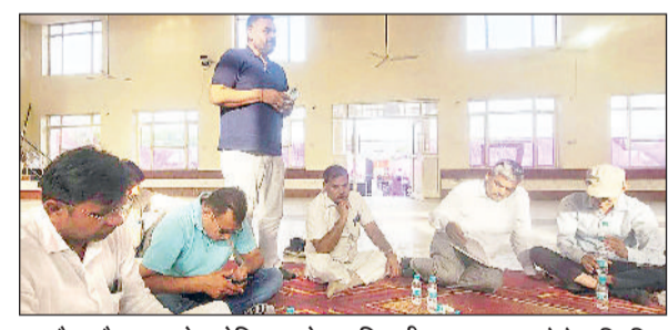
नारनौल। बैठक करते एसोसिएशन के पदाधिकारी।