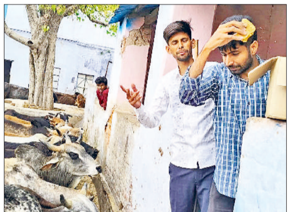
महेन्द्रगढ़। गाय को गुड़ खिलाते हुए।