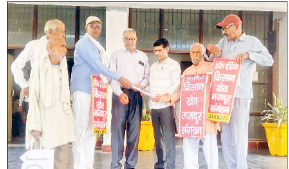
नारनौल। उपायुक्त कार्यालय के सुपरिटेण्डेंट को ज्ञापन सौंपते संगठन सदस्य व जैलाफ खोडमा में आंधी व बेमौसम बारिश से बिछी गेहूं की फसल।