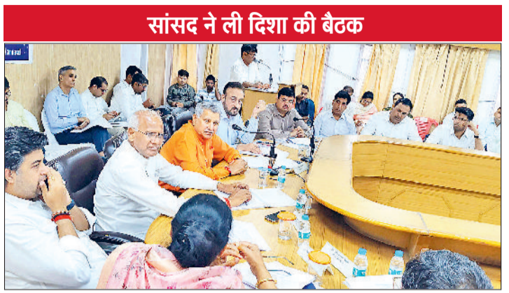
सांसद ने ली दिशा की बैठक

हरिभूमि न्यूज | नारनौल भिवानी-महेन्द्रगढ़ के सांसद धर्मबीर सिंह ने कहा कि विकसित भारत के संकल्प को धरातल पर उतारने के लिए अब गांवों में स्वच्छता के साथ-साथ समृद्धि का नया मॉडल तैयार किया जाएगा। प्रधानमंत्री के विजन के रूप में देसी खाद को बढ़ावा दिया जाएगा। इसके लिए पंचायतों की खाली जमीन पर विकसित भारत जी राम जी योजना से गड्डे खोदकर खाद तैयार की जाएगी। इससे न केवल गांव स्वच्छ होंगे, बल्कि कृषि को भी नई ताकत मिलेगी। सांसद शुक्रवार को पंचायत भवन में आयोजित डिस्ट्रिक्ट डेवलपमेंट कोऑर्डिनेशन एंड मॉनिटरिंग कमेटी (दिशा) की बैठक की अध्यक्षता कर रहे थे। उन्होंने केंद्र और राज्य सरकार की जनकल्याणकारी योजनाओं की समीक्षा की। सांसद ने कहा कि मुख्यमंत्री नायब सिंह सैनी के नेतृत्व में हरियाणा सरकार अत्योदय की भावना के साथ प्रदेश के चहुंमुखी विकास के लिए प्रतिबद्ध है। उन्होंने कहा कि स्वच्छ भारत मिशन ग्रामीण के तहत गांवों में कचरा प्रबंधन के लिए ठोस कचरा प्रबंधन शेड और तरल कचरा प्रबंधन के प्रोजेक्ट्स पर भी तेजी से काम किया जाए। सांसद ने बताया कि महात्मा गांधी राष्ट्रीय ग्रामीण रोजगार गारंटी योजना (मनरेगा) के तहत जिले में वित्तीय वर्ष में जल संरक्षण, भूमि विकास और ग्रामीण संपर्क जैसे महत्वपूर्ण कार्यों पर लगभग 896 लाख रुपये खर्च किए जा चुके हैं। उन्होंने विशेष रूप से अमृत सरोवर योजना की सराहना करते हुए कहा कि जिले में चिन्हित किए गए सभी 80 तालाबों पर कार्य शुरू हो चुका है, जिनमें से कई का कार्य