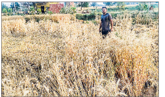
जैलाफ खोडमा में आंधी व बेमौसम बारिश से बिछी गेहूं की फसल।