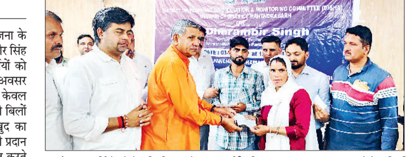
नारनौल। लाभार्थियों को चेक वितरित करते सांसद धर्मबीर सिंह।

प्रधानमंत्री सूर्य घर मुफ्त बिजली योजना के तहत शुक्रवार को सांसद चौधरी धर्मबीर सिंह ने दिशा बैठक के दौरान 13 लाभार्थियों को सब्सिडी के चेक वितरित किए। इस अवसर पर सांसद ने बताया कि यह योजना न केवल उपभोक्ताओं को भारी भरकम बिजली बिलों से निजात दिलाएगी, बल्कि उन्हें खुद का बिजली उत्पादक बनने का अवसर भी प्रदान करेगी। उन्होंने नागरिकों को प्रोत्साहित करते हुए कहा कि सौर ऊर्जा को अपनाकर हम पर्यावरण संरक्षण के साथ-साथ आर्थिक बचत भी कर सकते हैं। हरियाणा में इस योजना के प्रभावी कार्यान्वयन के लिए केंद्र व राज्य सरकार मिलकर भारी अनुदान दे रही हैं। योजना के